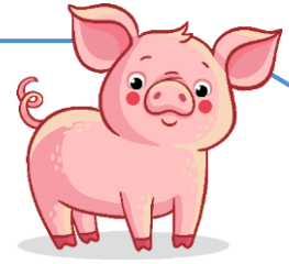
TABLA DEL 6 PRUEBA 4